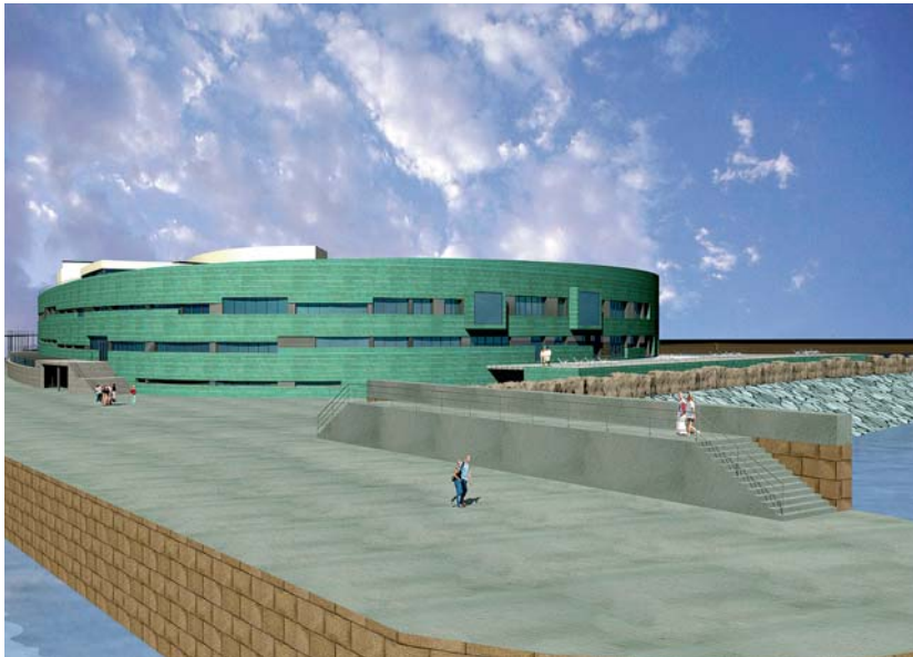
Las grandes instalaciones deportivas como la de la imagen centran el trabajo creativo de Naos.

En diecisiete años de vida, Naos se ha constituido en grupo de empresas para diversificar actividades: arquitectura, dirección de obra y asistencia técnica y, en tercer lugar, diseño gráfico. En su trayectoria ha ido captando nuevos socios, de los cuales algunos comenzaron como becarios. El 70% de sus obras van destinadas a las administraciones públicas. Sus instalaciones deportivas son apreciadas en toda España. Clubs de fútbol de renombre, sociedades deportivas y administraciones públicas le adjudican el grueso de sus proyectos por