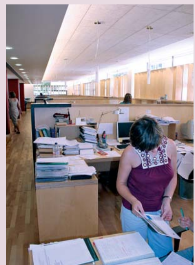
Detalle del estudio central en Oleiros (A Coruña).